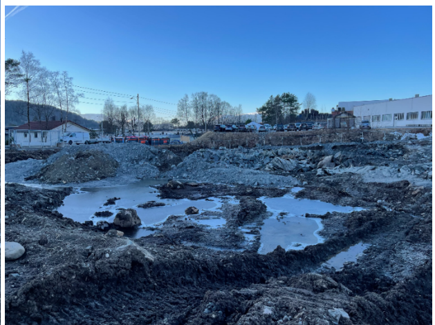
Bilete nr. 11 og 12