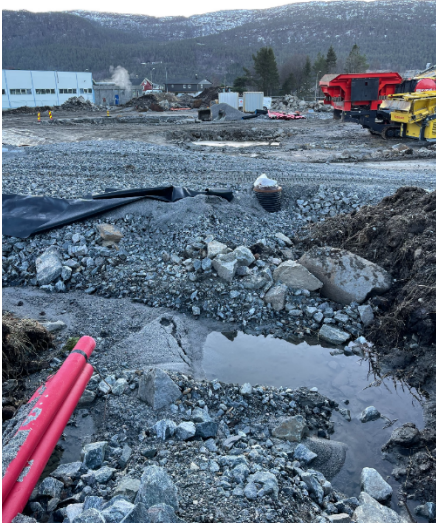
Bilete nr. 1 og 2