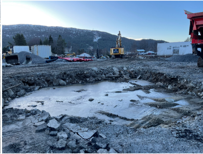
Bilete nr. 3 og 4