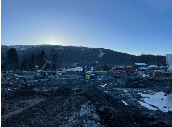
Bilete nr. 9 og 10